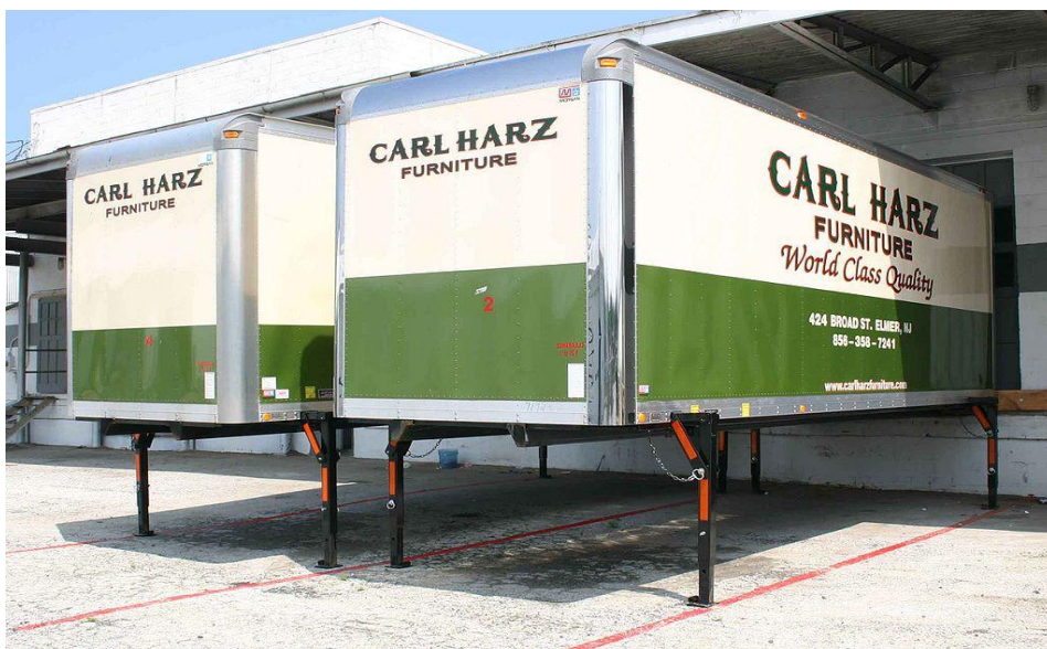
图 3 可拆卸箱体

公铁两用挂车、滚装船和铁路平车属于多式联运运载单元的工具。其中，公铁两用挂车即可由汽车牵引，也可由货车牵引，在美国广泛使用。美国密西西比河和欧洲莱茵河中普遍使用专业的滚装船运输载货汽车或（半）挂车，但是我国长江上目前还没有专业的半挂车滚装船，长江滚装运输发展潜力巨大。欧盟《组合术语》中，给出了不同类型的铁路平车，如可转向平车（Basket Wagon）、骨架式平车（Spine Wagon）、铁路敞车（Pocket Wagon）、低底盘平车（Low Floor Wagon）。但是这些装备在我国还没有，因此只给出了铁路平车的概念。