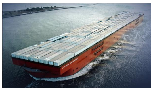
图 4 滚装船