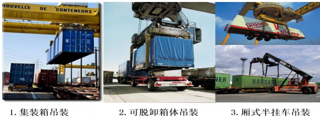
图 1 欧洲标准化运载单元及其转运吊装形式

迄今欧洲已发展起三种基本的标准化运载单元，即集装箱、可脱卸箱体（swap-body）、厢式半挂车（semi-trailer），如图 1 所示。