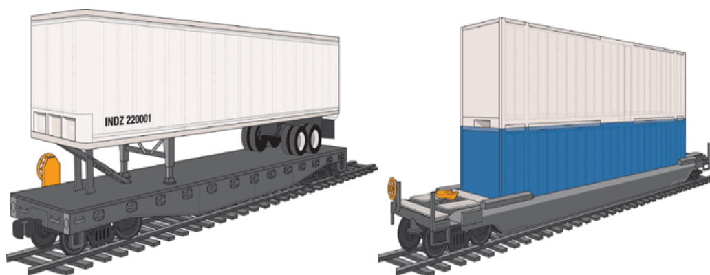
图 2 驼背运输、箱驮运输

对联合运输、多式联运、组合运输、运载单元、运载单元、集装箱多式联运等多式联运最基本的概念进行了定义，在基本概念的基础上提出了公铁联运、铁水联运、海铁联运、水水联运、公水联运、空陆联运、公空联运、铁空联运、公铁水联运等多式联运基本模式的概念，滚装运输、驼背运输、箱驮运输、铁路双层集装箱运输、卡车航班等均属于多式联运基本模式的特定形式，尤其特有的技术内涵。